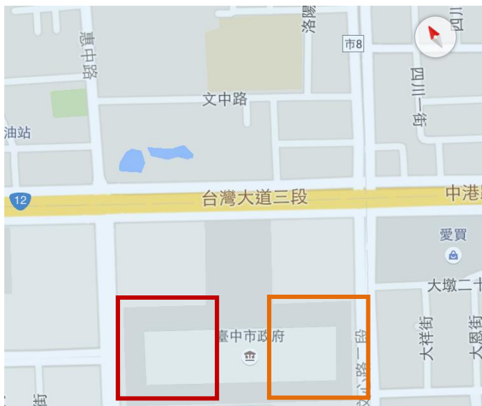
臺灣大道市政大樓 地圖示意

紅色方塊為惠中樓(A棟) 橘色方塊為文心樓(B棟) 畫面右邊為往火車站方向 畫面左邊為往國道1號方向