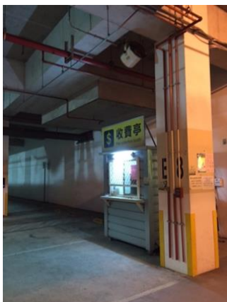
離開時請拿公 文到此收費亭 消磁