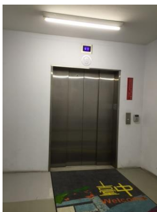
貨運用的電梯 (1號、13號) 分別於惠中樓 臺灣銀行後方 及文心樓7-11 後方

紅色方塊為惠中樓(A棟) 橘色方塊為文心樓(B棟) 畫面右邊為往火車站方向 畫面左邊為往國道1號方向