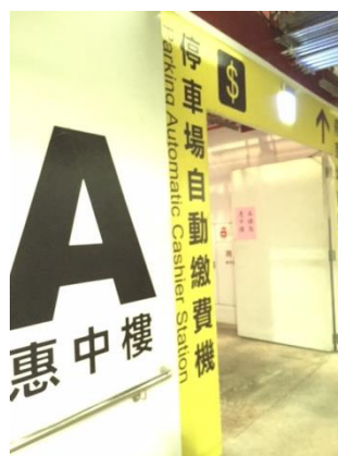
地下一樓通往惠 中樓通道